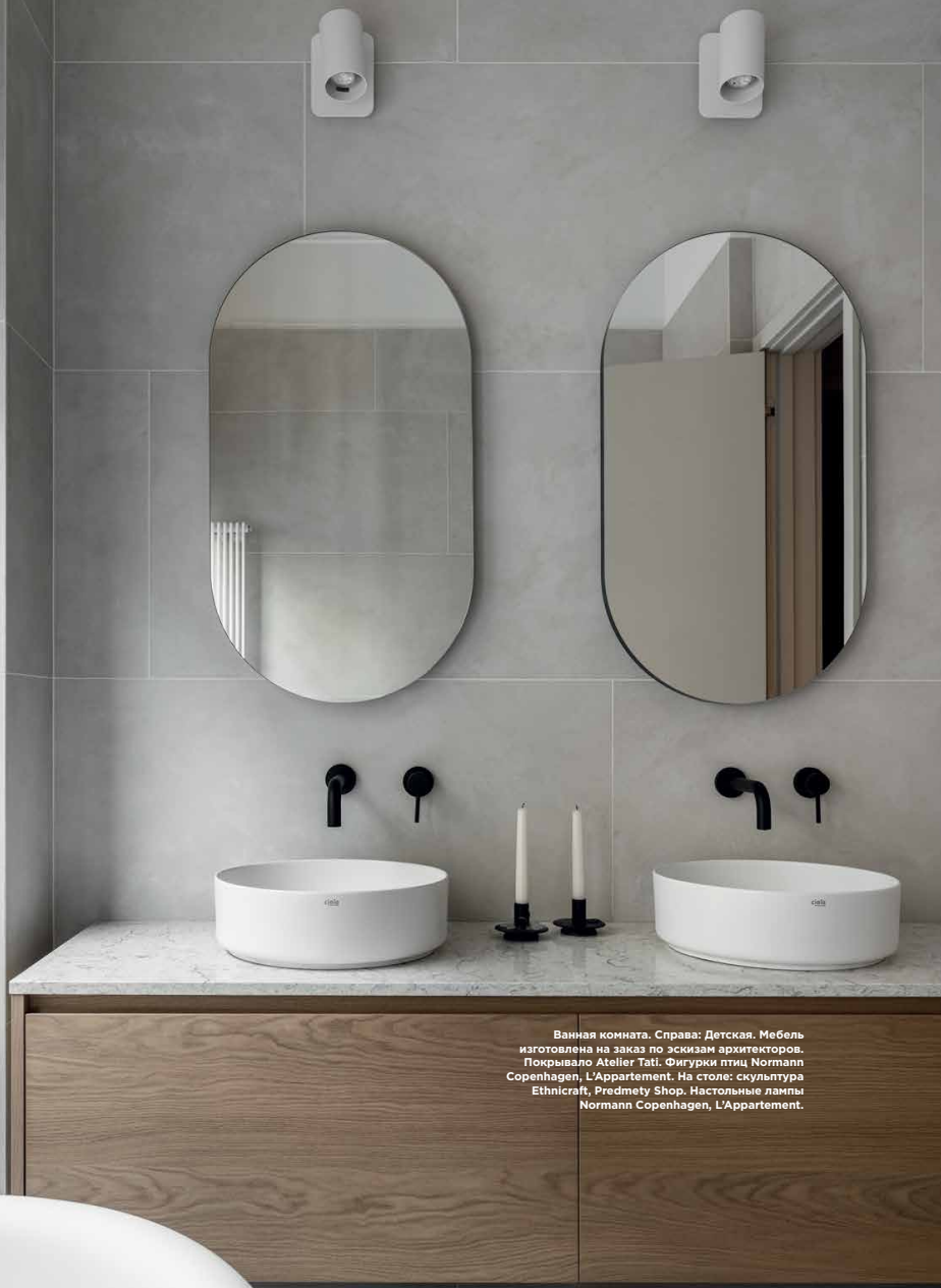
Ванная комната. Справа Детская. Мебель изготовлена на заказ по эскизам архитекторов. Покрывало Atelier Tati. Фигурки птиц Normann Copenhagen, L'Appartement. На столе: скульптура Ethnicraft, Predmety Shop. Настольные лампы Normann Copenhagen, L'Appartement.